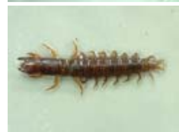
ヘトボ 比較的にきれいな川の石の下にすむ。「孫太郎虫」と呼ばれ、 かん 猪の虫や きょうせい 強精の薬とされている。