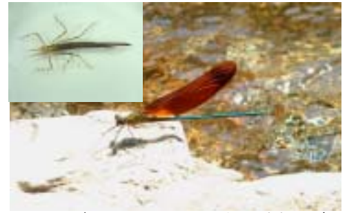
ミヤマトボ 左上:幼虫(ヤゴ) 日本産カワトンボの中では最大級。山間の溪流に多いので「深山(ミヤマ)」と呼ばれる。