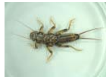
オヤマカゲラ 肉食性で体長30mm前後の大型のカワゲラ。上流域の流れがやや速い所に多い。