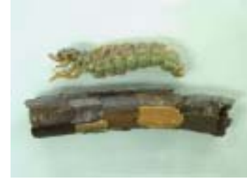
トビケラ 成虫の羽が紫色であるところからつけられた。トビケラの中では最大で、全長40mmにもなる。