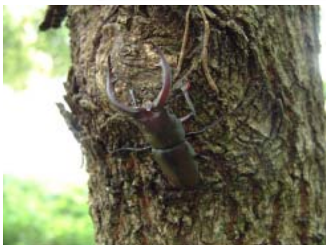
ノコギリクワガタ